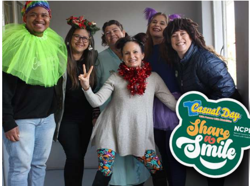
PERONEEL "SHARE A SMILE" OP LOSLITDAG 2023.

Baie dankie aan elkeen wat op Vrydag, 21 April 2023 ons Op Wip Koffiewinkel, ons jaarlikse spoggeleentheid o.l.v. Feedem, ondersteun het.