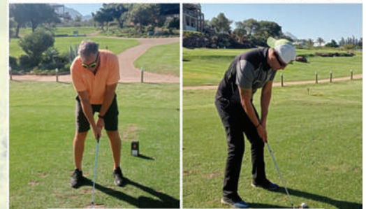
Putjie 9, waar spelers geblinddoek afslaan, en R100 00 geborg deur Petals Express op die spel was, is jaarliks 'n hoogtepunt

BMP GROEP DRUKKERY (EDMS) BPK H/W: 61 PIONEERDRUKKERY • ALLE LINDING DRUKKERS • BNP PRINTING DISTILLERYWEG 4, WORCESTER • TEL: 023 342 2073