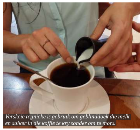
Verskeie tegnieke is gebruik om geblinddoek die melk en suiker in die koffie te kry sonder om te mors.