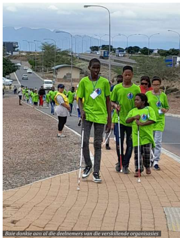
Baie dankie aan al die deelnemers van die verskillende organisasies

Baie dankie aan PUMA, The Greenleaf Olive Company, The Promo Group, Twee Oseane Akwarium, Coca-Cola Peninsula Beverages, Madrassa An-Noor for the Blind, Worcester Gemeenskapsdiens, al die gidse en die bestuur en personeel van Mountain Mill Mall.