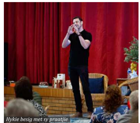
Hykie besig met sy praatjie

Baie dankie aan elke gas, borg en diensverskaffer wat bygedra het tot die sukses van hierdie geleentheid!