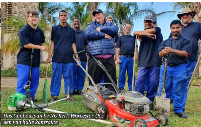
Ons tuinbouspan by NG Kerk Worcester-Oos, een van hulle kontrakte