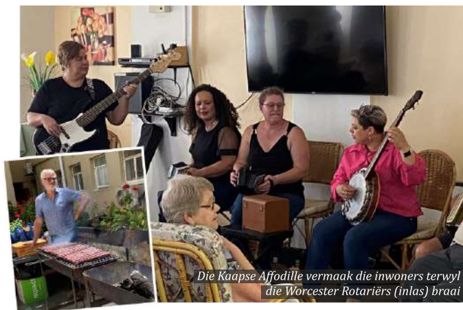
Die Kaapse Affodille vermaak die inwoners terwyl die Worcester Rotariërs (inlas) braai