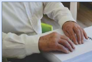
BRAILLE-BYBEL BEKENDSTELLING 4