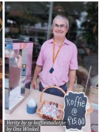
Verity by sy koffiestalletjie by Ons Winkel.