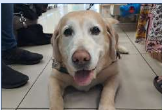
OOGSORGMAAND GEVIER 3