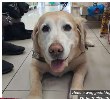
Helene wag geduldig vir haar eienaar.