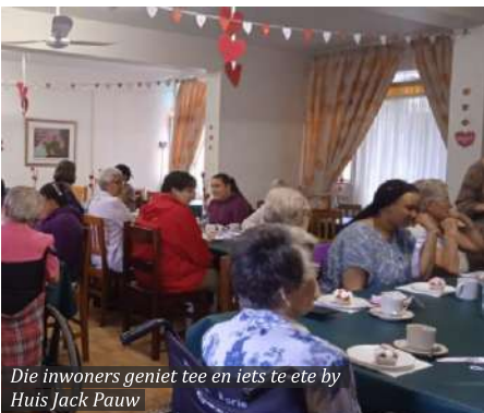
Die inwoners geniet tee en iets te ete by Huis Jack Pauw

Ter viering van die maand van liefde het die jong dames van Huis Jack Pauw (tehuis vir dames en getroude paartjies) die inwoners van Huis Brevis (tehuis vir bejaardes) genooi vir 'n koppie tee met die doel om nuwe vriendskappe te vorm.