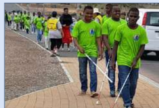
LANGKIERIE RALLY IN WORCESTER 7

NPO 011-891 023 347 2745 Kerkstraat 132, Worcester 6850 Posbus 933, Worcester 6849 info@innovationfortheblind.org www.innovationfortheblind.org