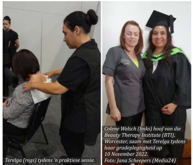
Terelga (regs) tydens 'n praktiese sessie.