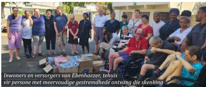
Inwoners en versorgers van Ebenhaezer, tehuis vir persone met meervoudige gestremdhede ontvang die skenking

Ons opregte dank en waardering aan elke gemeentelid wat bygedra het tot hierdie projek.